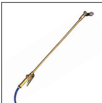
Esclusivo kit lancia con ugello nebbia per una migliore nebulizzazione della soluzione sanificante negli ambienti .