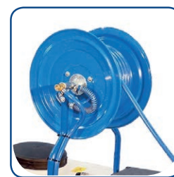
Avvolgitubo con 50 m tubo ø 10x17, 50 bar