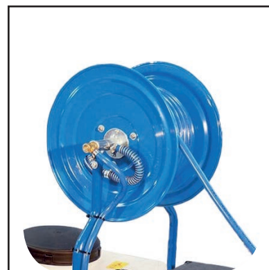
Tubo alta pressione mt 50 con avvolgitubo