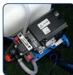
Gruppo motore-pompa 1,5 HP 220v monofase