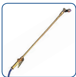
Lancia nebbia cm 60 per una migliore sanificazione degli ambienti