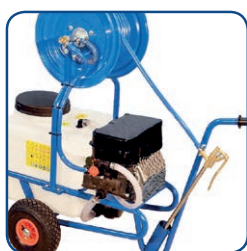
Compatta e facile da trasportare